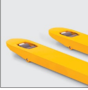
Palete kolay giriş için yuvarlatılmış çatal uçları