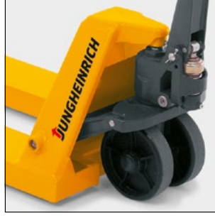
Bakım gerektirmeyen hidrolik